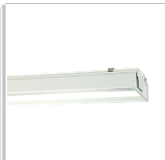
Oiva 470TMS/471TMS/475TMS реечный светильник с широким светораспределением.