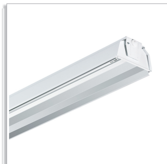
Oiva 470TMS/471TMS/475TMS batten with wide-beam light distribution