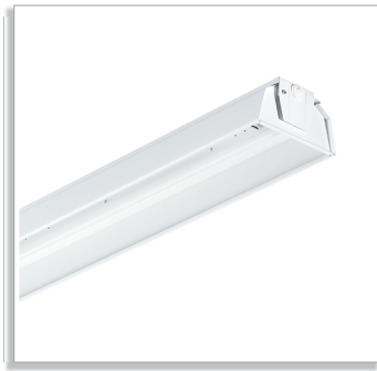
Oiva 470TMS/471TMS/475TMS batten with white reflector without lamellae